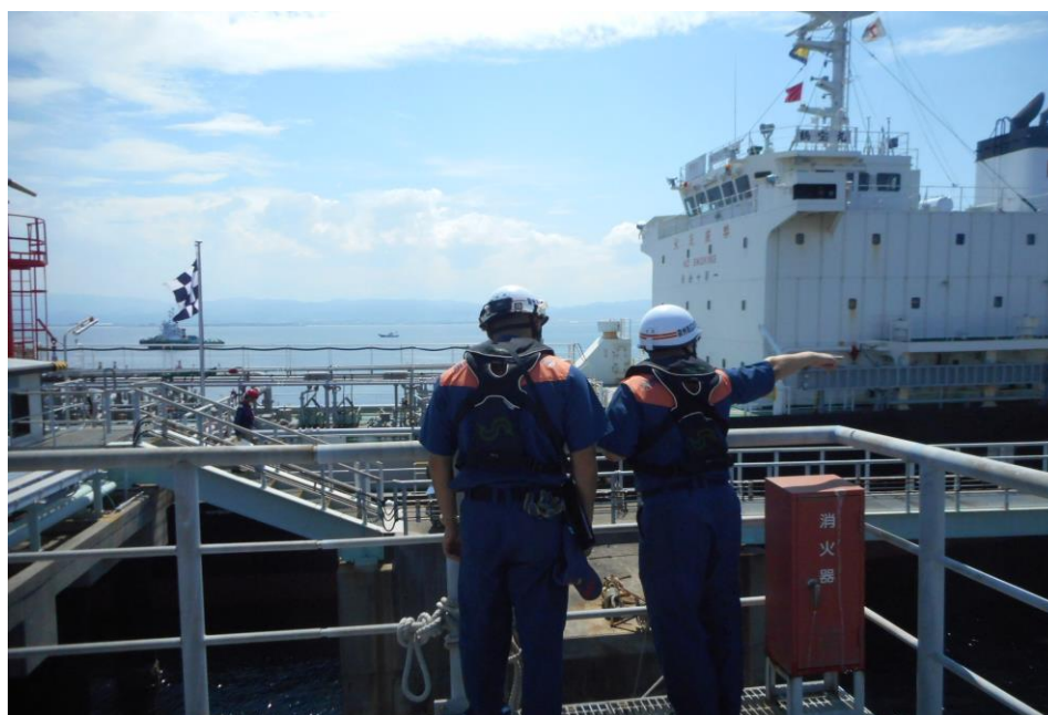
関西国際空港の移送取扱所検査の状況