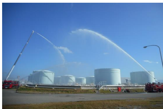
関西国際空港給油センター