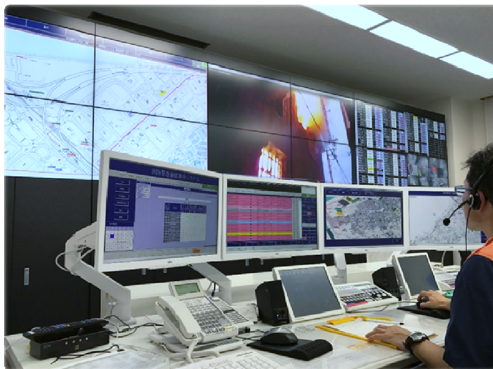
消防指令センター