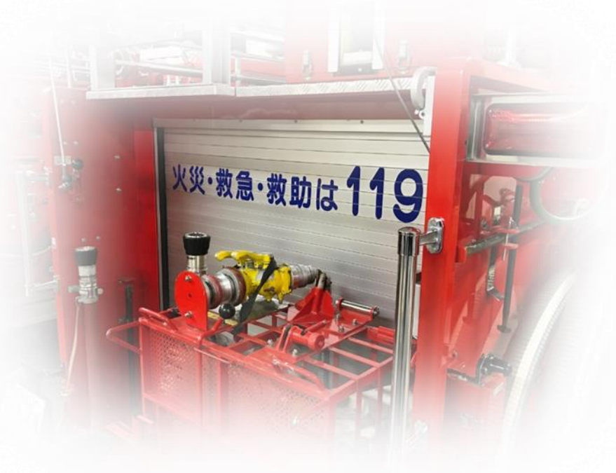
消防指令センター