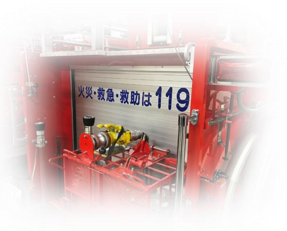
消防指令センター